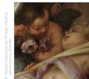
© Museo Nacional del Prado, Madrid. Xehetasuna, Detalle.

artistas se esforzaban por crear imágenes que compendiaran toda la belleza, la dulzura y la devoción asociadas a la Virgen. Entre ellos destacó Murillo, que logró una fórmula perfecta, en la que se conjugan perfección femenina, esplendor luminoso, énfasis ascensional, solidez compositiva, una gama cromática variada y armónica a la vez, y un estilo pictórico vibrante y vaporoso, que constituye la mejor traducción de la gloria de María.