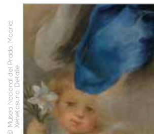
Xehetasuna, Detalle.

ahalegintzen ziren Andre Mariarekin lotutako edertasuna, gozotasuna eta debozioa islatzen zuten irudiak sortzen. Horien artean, Murillo nabarmendu zen. Izan ere, formula perfektua lortu zuen, hainbat ezaugarri uztartzen zituen: emakume perfektua, argi distiratsua, goranzko enfasia, konposizio sendoa, kolore sorta askotarikoa eta aldi berean harmoniatsua, eta estilo piktoriko sutsu eta fina, Mariaren loriaren interpretazio onena.