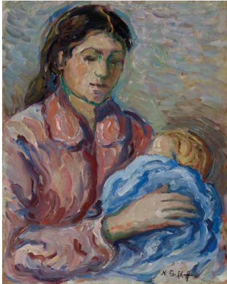
Femme au corsage rouge et l'enfant blond Blusa gorridun emakumea eta haur ilehoria Mujer con blusa roja y niño rubio 1906