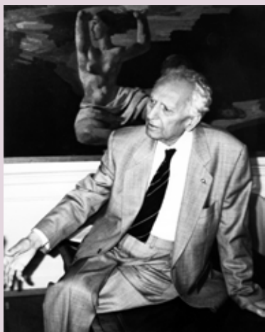
Oscar Ghez Musée Petit Palais. Ginebra. Suiza

La dación en pago de impuestos para el incremento de los fondos de un museo, supone la acción de entregar un bien a cambio de saldar una deuda fiscal -en este caso con la Diputación Foral de Álava-, siempre y cuando la institución esté interesada en aceptar las obras por su valor artístico, histórico o documental, para que formen parte de su patrimonio cultural. Este pago generalmente lo realizan grandes empresas, bancos y cajas, así como herederos de artistas muy importantes. Son procedi-