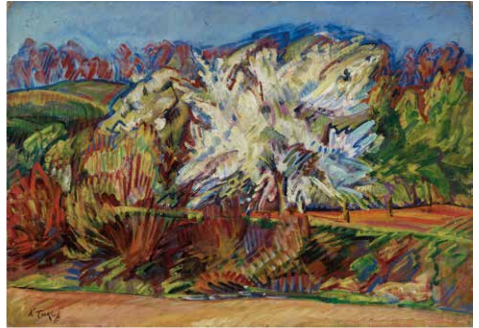
Paysage à l'arbre en fleurs Paisaia zuhaitz batekin lorean Paisaje con árbol en flor Hacia 1912-1920