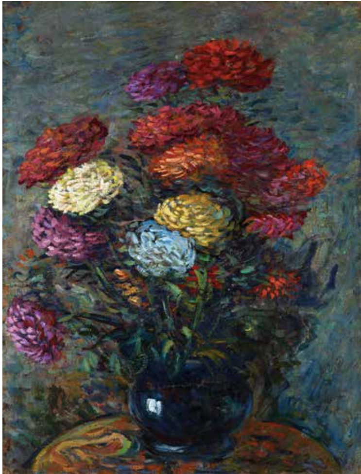
Les dahlias au vase bleu Daliak loreontzi urdinean Las dalias en jarrón azul Hacia 1905 ingurukoa