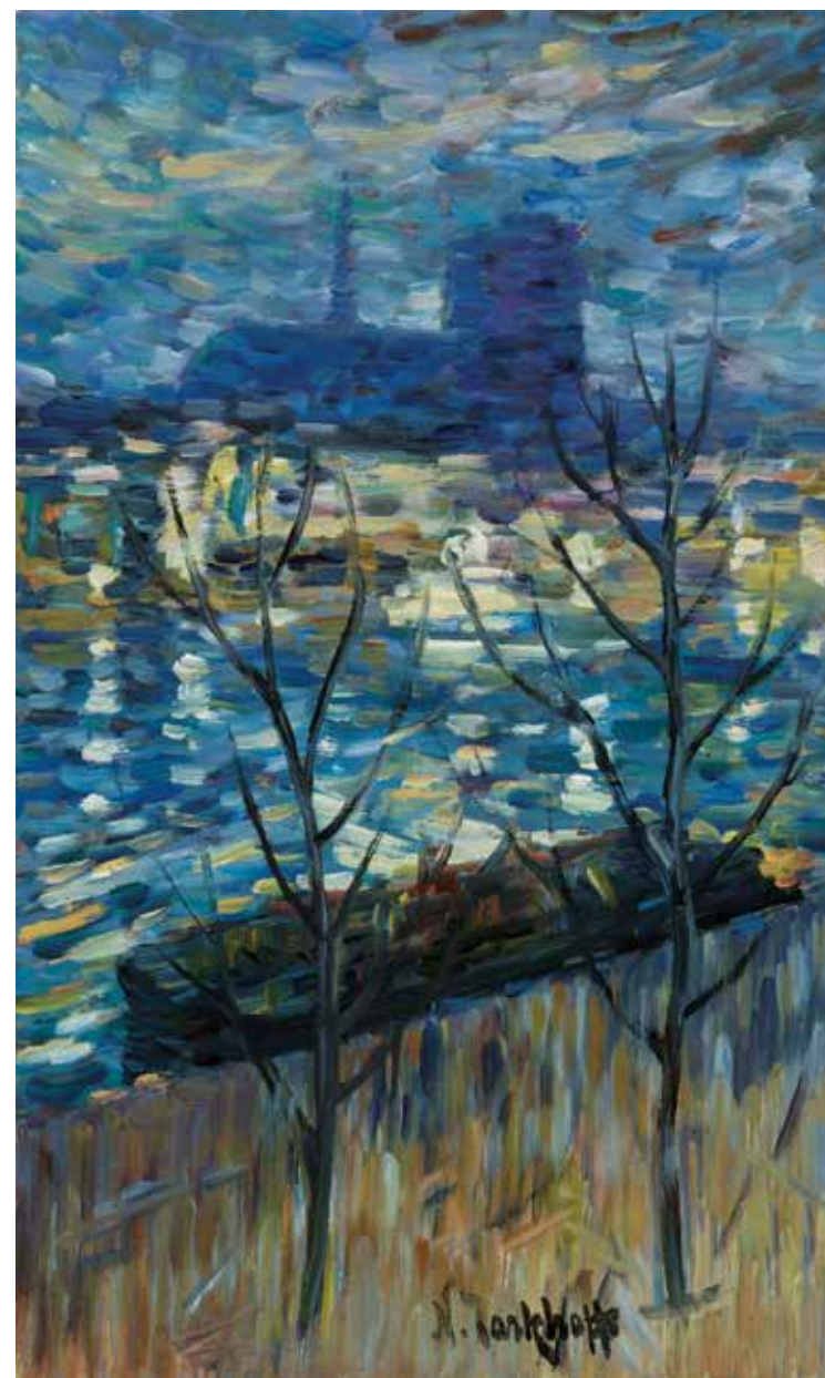
La Seine et Notre-Dame la nuit Sena eta Notre Dame gauetz El Sena y Notre Dame de noche Hacia 1901-1904 ingurukoa