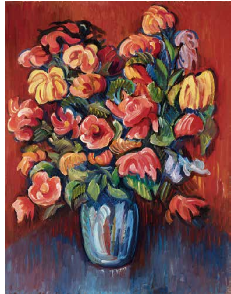
Bouquet de fleurs printanières Udaberriko lore sorta Ramo de flores de primavera Hacia 1905 ingurukoa