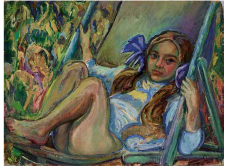
Fille allongée Neskatoa etzanda Niña tumbada Hacia 1918 ingurukoa