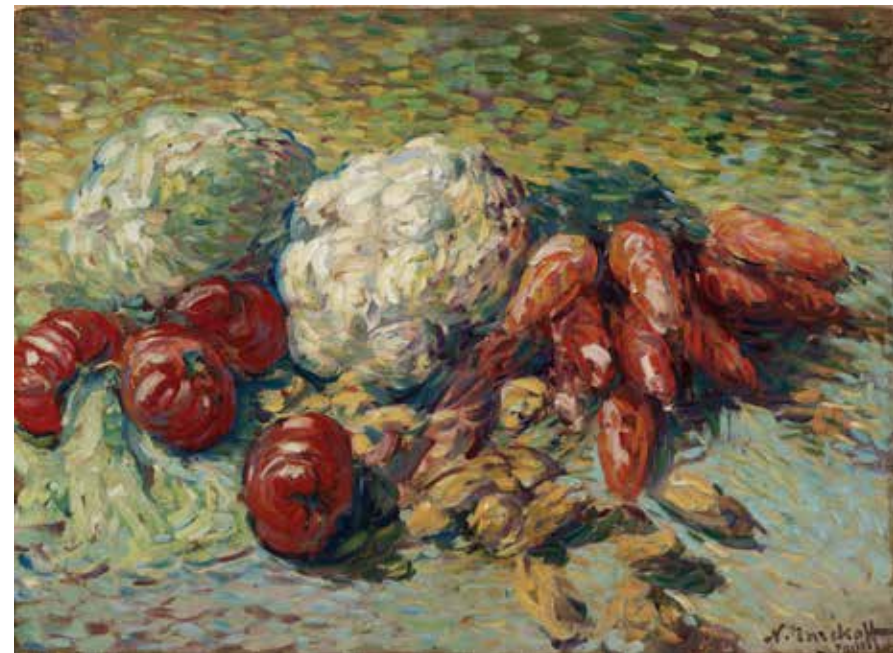
Nature morte aux légumes Natura hila barazkiekin Naturaleza muerta con verduras Hacia 1905 ingurukoa