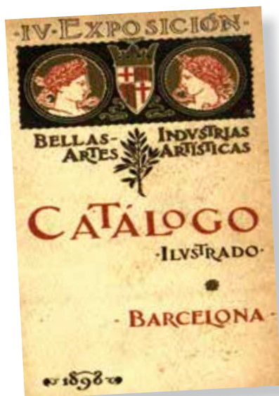
Bartzelonako arte ederren eta arte industriren erakusketa. 1898.