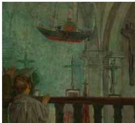
Meza nagusia Derioko elizan edo Korua 1898 Mihise gaineko olio pintura 93 x 164 cm 2017an erosita

Artistaren heldutasuneko obra bat da, konposizio arriskutsu eta konplexukoak; zoruko diagonalak du bereizgarri, eta bertan margolariak argia harrapatzen aditua dela erakusten du. Barruko eszena da, non pertsonaia desberdinek, atzeraka, belauniko edo koruko balaustradan bermatuta, goitik begiratzen baitute une horretan ematen ari den meza. Hondoko argi intentsitatea, alboetatik sartzen den argiaren ondoriozkoa, fededunek daramatzaten kandelak indartzen dute. Aitzitik, koruko pertsonaia ilunantzean agertzen dira, argi-ilun gogor batean, kutsu gorri txikiak eta zenbait zulatatik eta zureko arrakaletatik iragazten diren kandelaren argiek eragindako kontrastean. Horrek guztiak naturaltasun handia ematen dio eszenari. Elizako gurutzadurako