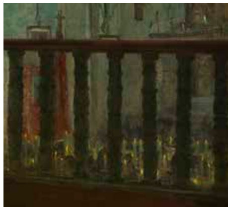
Misa mayor en la iglesia de Derio o El coro 1898 Óleo sobre lienzo 93 x 164 cm Adquisición: 2017

Se trata de una obra de madurez del artista, con una composición arriesgada y compleja, marcada por la diagonal del suelo y en la que el pintor muestra su dominio en la captación de la luz. Es una escena de interior donde distintos personajes, de espaldas, arrodillados o apoyados en la balaustrada del coro, contemplan desde lo alto la misa que se está celebrando en esos momentos. La intensidad luminosa del fondo, provocada por la luz que entra por los laterales, se ve reforzada por los cirios que portan los fieles. Por el contrario, los personajes del coro aparecen en penumbra en un fuerte claroscuro, contrastado por pequeños toques rojos y por la luz de las velas que se filtran a través de