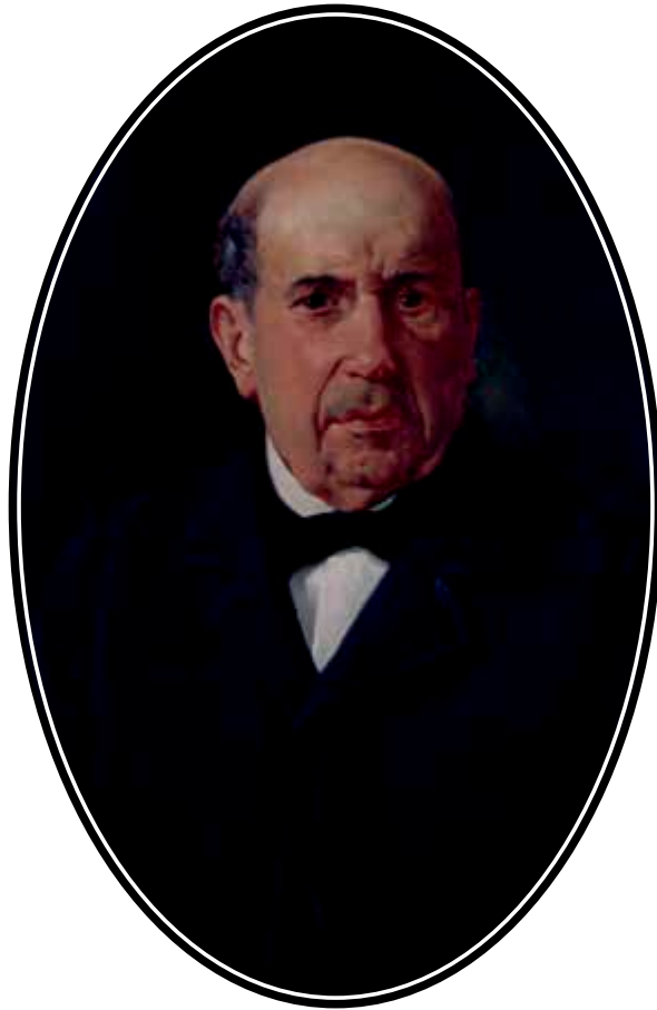
Jaun baten erretratua 1890 Mihise gaineko olio pintura 76 x 53,5 cm 2000an erosita