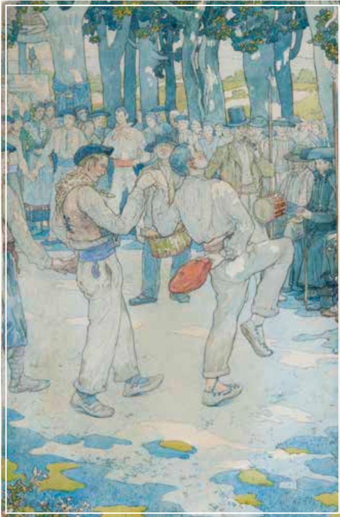
Aurrekua 1900-1901 aldera Paper gaineko akuarela 450 x 300 mm 2001ean erosita