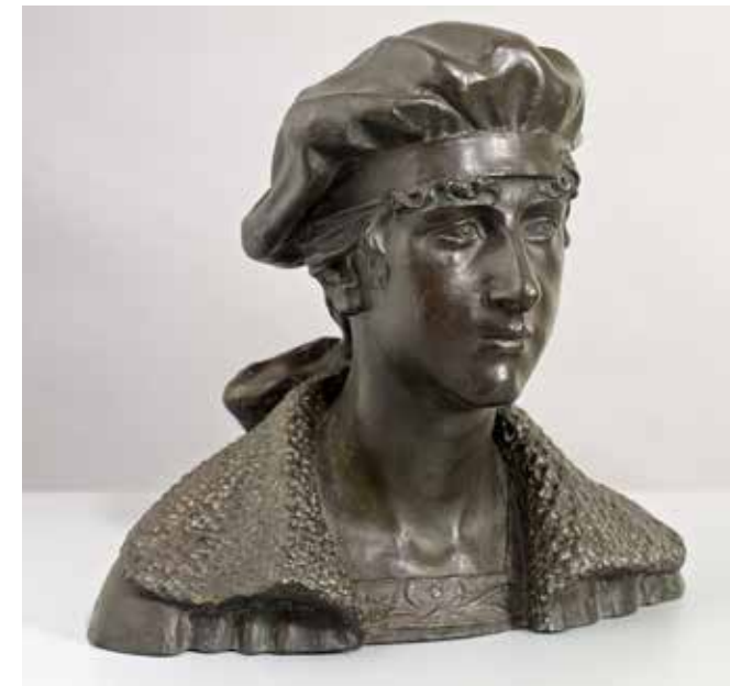
Nire alaba. Mi hija. Hacia 1916-1920 aldera

Arabako Arte Ederren Museoa. Museo de Bellas Artes de Álava