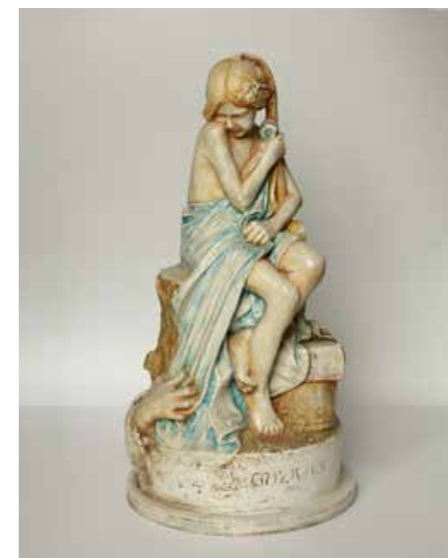
Euzkadi, 1907ko Bartzelonako Nazioarteko Erakusketara aurkeztutako obra. Euzkadi , obra presentada a la Exposición Internacional de Barcelona de 1907.

Como la mayor parte de los escultores del momento, Fernández de Viana toca todos los géneros escultóricos y emplea materiales muy diversos. Destaca su labor como autor de escultura conmemorativa con el desaparecido monumento a Felipe Dugiols en Tolosa (Gipuzkoa). Hay que mencionar también su labor dentro de la escultura funeraria, costumbrista, de retratos y especialmente en la escultura religiosa. Es en este apartado donde desarrolla una obra más abundante aunque en ocasiones menos libre al estar sometido al encargo. Respecto a los materiales, además de la piedra, la madera y el mármol, el escultor utiliza muchas veces la