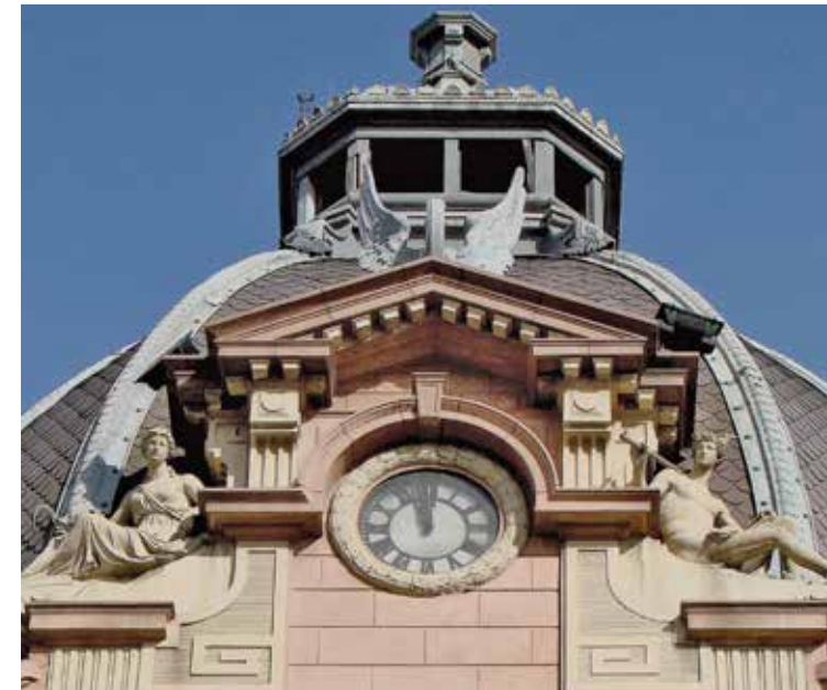
Nekazaritzaren eta Merkataritzaren irudiak. 1916 inguruan.

Garai hartako eskultore gehienek bezala, Fernández de Vianak ere eskulturako genero guztiak landu zituen eta askotariko materialak erabili zituen. Nabarmentzekoa da Felipe Dugiolsen