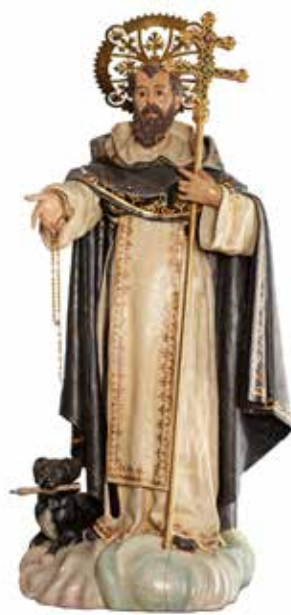
Santo Domingo de Guzmán.

Farolen Museoa Museo de los Faroles, Vitoria-Gasteiz