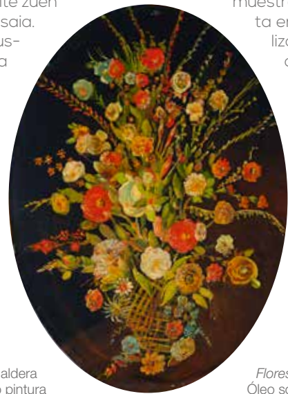
Loreak, 1958 aldera Mihise gaineko olio pintura