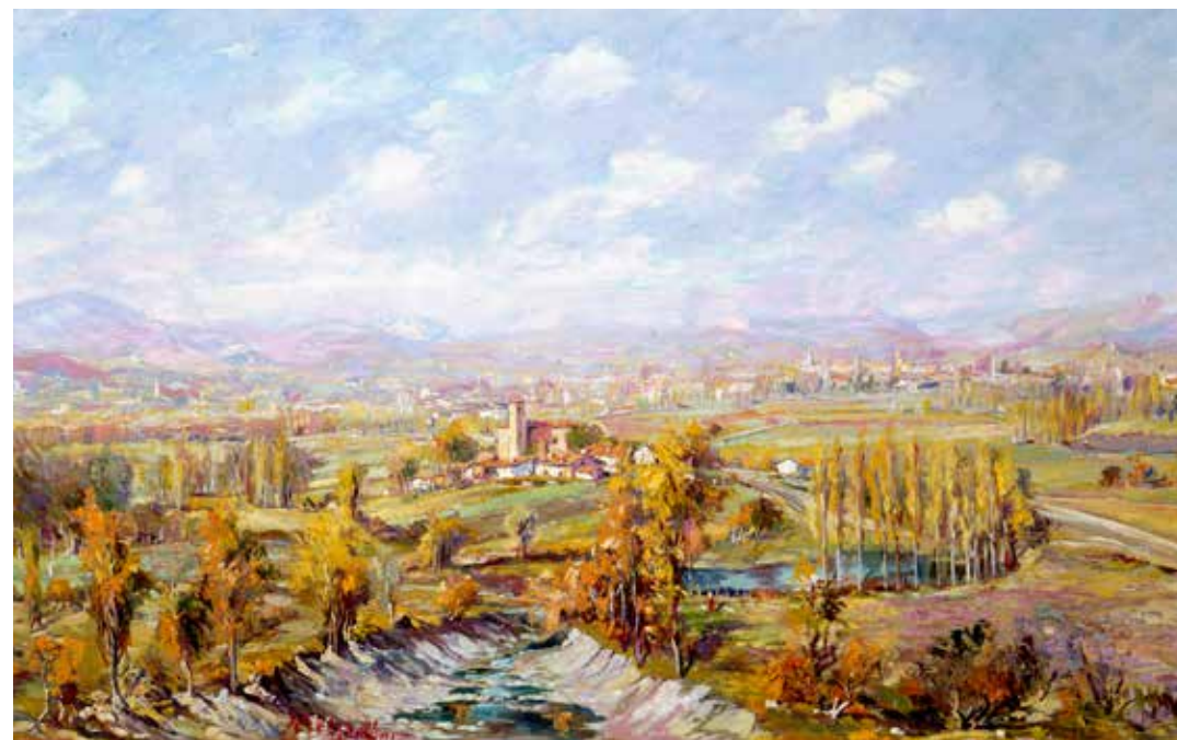
Panoramika Berroztegiatik. Arabako Lautada, 1951 aldera Mihise gaineko olio pintura

tan querido por el artista. En esta ocasión utiliza un punto de vista en altura que muestra el pueblo de Berrostequieta en un plano medio; está realizado en pinceladas largas de origen impresionista y luces veladas.