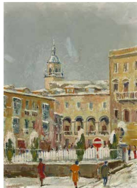
Gasteizko ikuspegia. Olagibel kalea arkupeekin eta Done Mikeleko dorrearekin, 1954 aldera Kartoi gaineko olio pintura